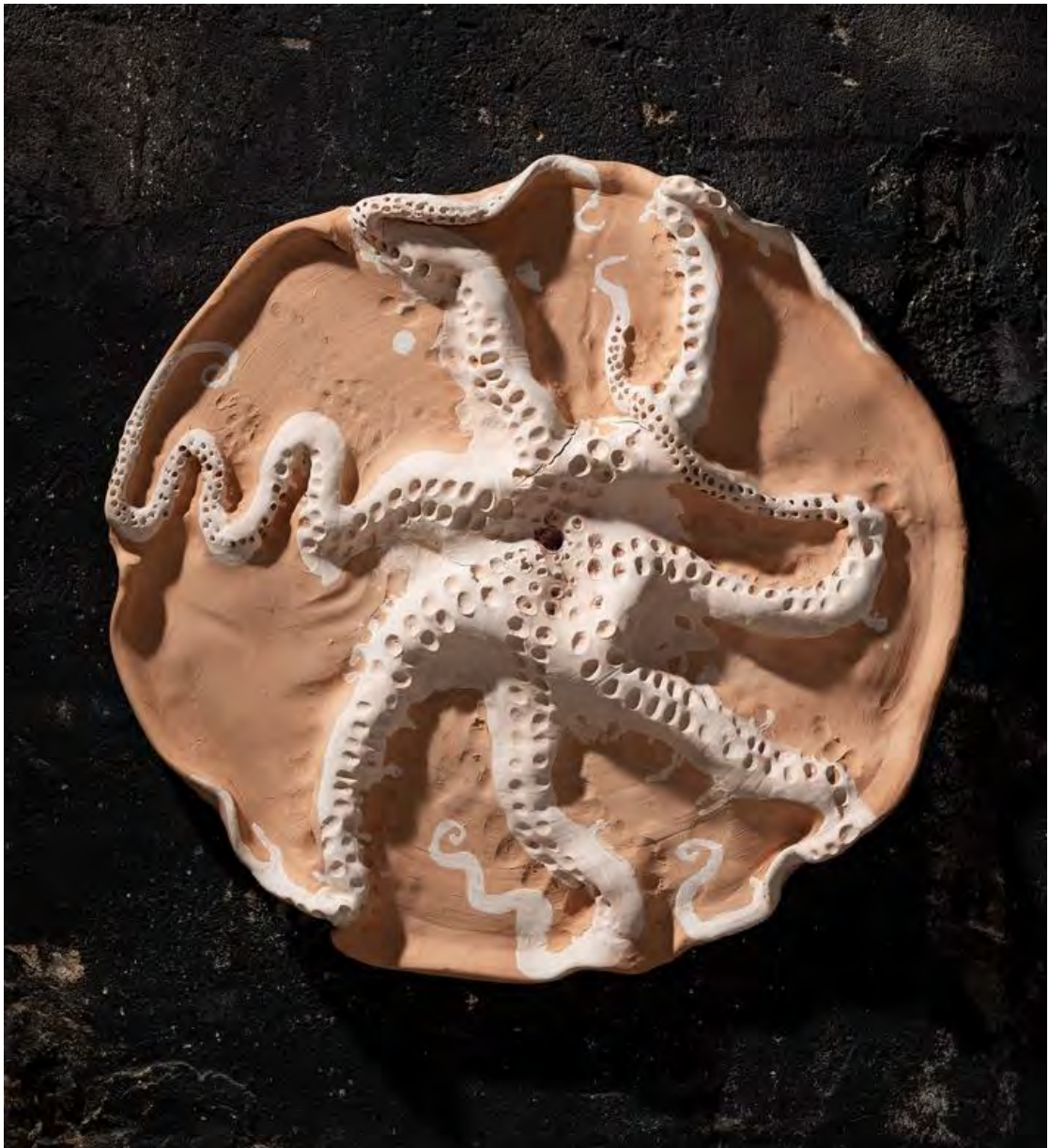
Poulpe à l'envers , 2001. © Miquel Barceló, VEGAP, Barcelona, 2024.