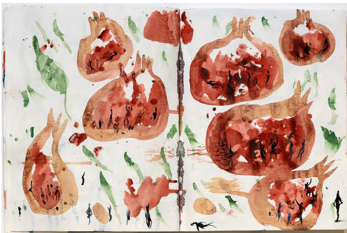
Quadern, juliol-agost 2021. Grècia, Artà (Mallorca). © Miquel Barceló, VEGAP, Barcelona, 2024.

Els quaderns estan fets en llocs tan diferents com Mallorca, Grècia o el Japó.