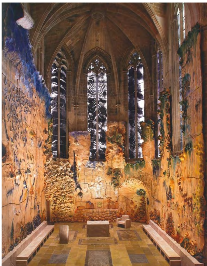
Capella del Santíssim de la catedral de Mallorca.

Barceló també va dissenyar les vidrieres de la capella. En aquest àmbit veiem uns quants estudis preparatoris per a aquesta obra.