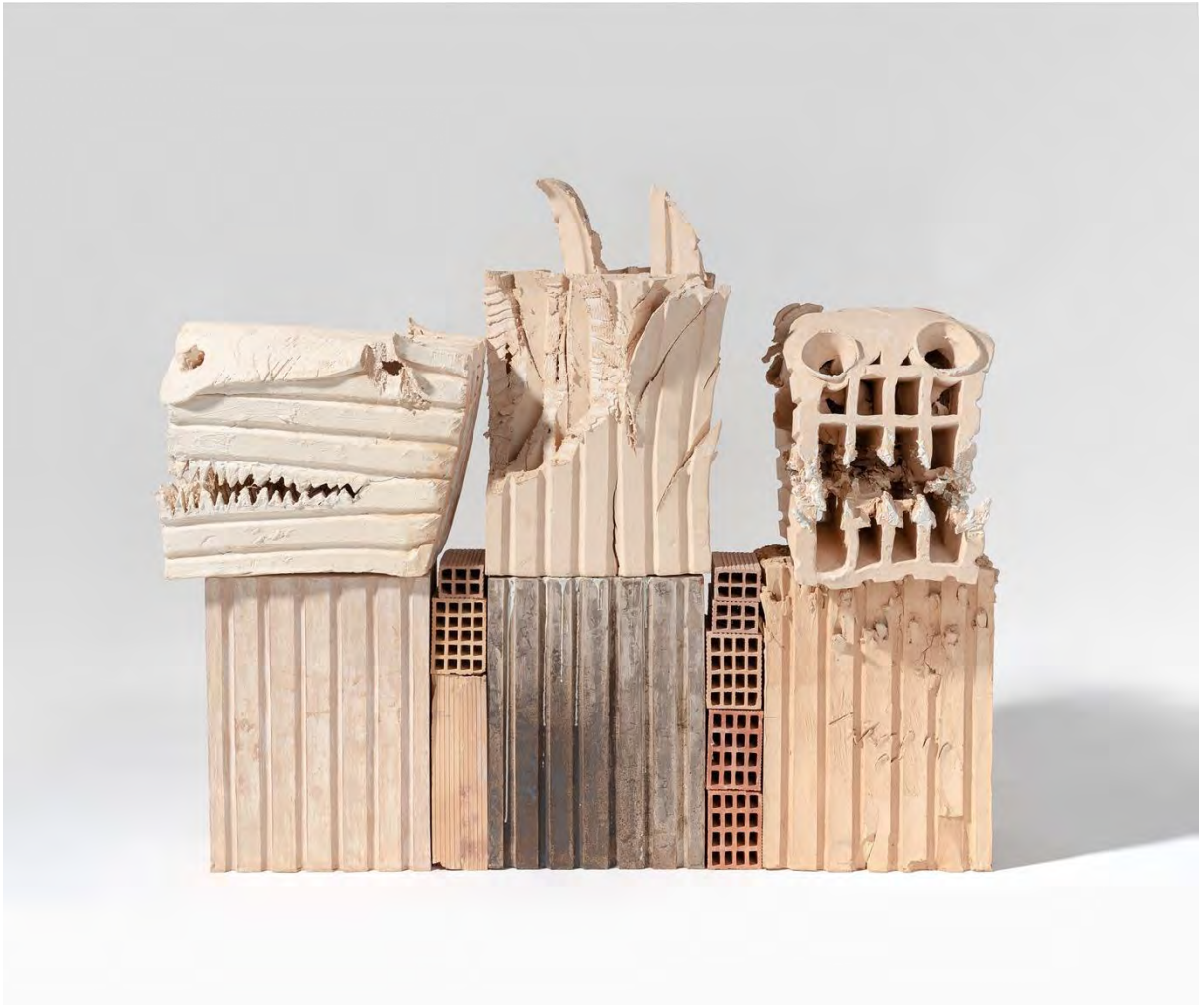
Tòtem , 2019. © Miquel Barceló, VEGAP, Barcelona, 2024.

L'aspecte d'aquestes construccions recorda els jaciments arqueològics d'altres civilitzacions. De vegades fan referència a capitells grecs o precolombins, o suggereixen caps de dracs o monstres fantàstics.