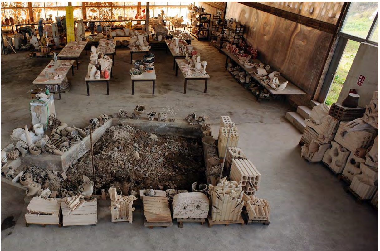
Taller de Vilafranca de Bonany, Mallorca.

Barceló ha creat unes quatre mil ceràmiques. S'ha convertit en un dels artistes més destacats d'aquest mitjà artístic que també va interessar a Picasso i a Miró.