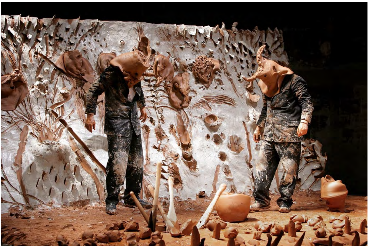
Fotograma extret de la filmació d'Agustí Torres de la representació al Festival d'Avinyó, del 16 al 27 de juliol de 2006. © Miquel Barceló, VEGAP, Barcelona, 2024.

La representació requeria un gran esforç físic. L'obra acaba amb els dos actors travessant el mur de fang. El projecte fou molt ben rebut pel públic i per la crítica. Es va representar en moltes ciutats, de Venècia a Nova York, passant per Barcelona i pel país dels dogons.