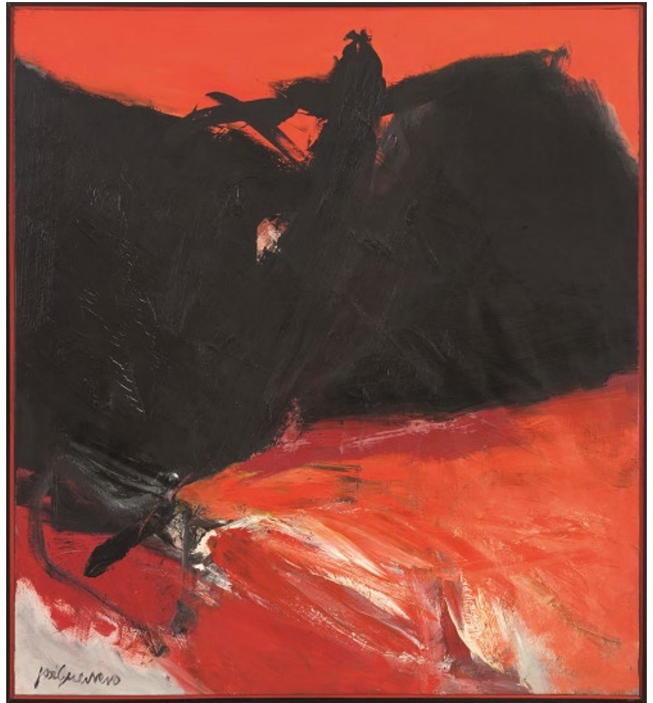
Rojo sombrío , 1964 Colección Fundació Juan March, Museo de Arte Abstracto Español, Conca © José Guerrero, VEGAP, Barcelona, 2022