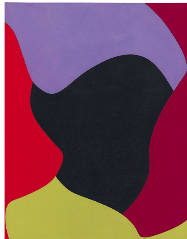
EQUIPO 57 PA-8, 1959 Col·lecció Fundació Juan March, Museo Fundació Juan March, Palma

La exposición “Los caminos de la abstracción, 1957-1978. Diálogos con el Museo de Arte Abstracto Español de Cuenca», concebida y organizada por la Fundación Catalunya La Pedrera y la Fundación Juan March, además de poner de relieve la génesis del primer museo de la abstracción en España, presenta una importante selección de obras de su colección junto con otras de artistas nacionales e internacionales prestadas por diversos museos y colecciones particulares.