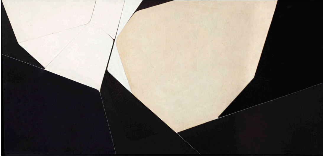
Pablo PALAZUELO Omphale V , 1965-1967 Col·lecció Fundació Juan March, Museo de Arte Abstracto Español, Conca

La Fundación Catalunya La Pedrera presenta una importante exposición, organizada en colaboración con la Fundación Juan March , que hace una revisión del movimiento de la abstracción en España entre los años 1957 y 1978, en diálogo con las corrientes artísticas europeas y americanas de este período.