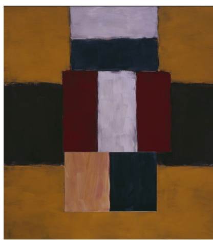
Fez , 2024 © Sean Scully.