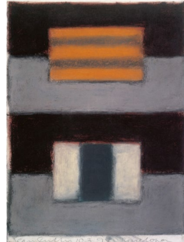
Barcelona 10.3.98, 1998 © Sean Scully. Gentilesa de l'artista

La seva relació amb Barcelona també es veu a la mostra amb una selecció de fotografies feta a la ciutat catalana l'any 1997 que il·lustra aquesta altra faceta creativa de l'artista, així com una tria de dibuixos, aquarel·les i pastels . Aquesta mostra inclou també una interessant selecció d' escultures , de diferents mides i materials, mitjà que ha utilitzat amb força els darrers anys. Escultures en pedra, alumini, zenc o vidre de Murano conviuran a la sala amb les seves obres de paret, i que s'exposen per primer vegada a Barcelona .